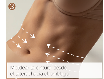
Moldear la cintura desde el lateral hacia el ombligo.