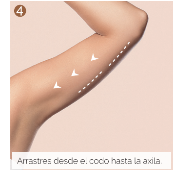
Arrastres desde el codo hasta la axila.