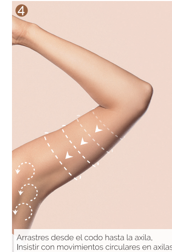
Arrastres desde el codo hasta la axila. Insistir con movimientos circulares en axilas.