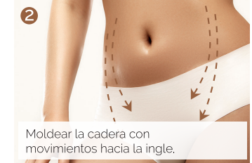
Moldear la cadera con movimientos hacia la ingle.