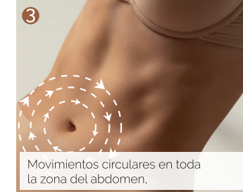
Movimientos circulares en toda la zona del abdomen.